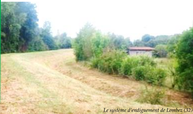
Le système d'endiguement de Lombez (32)