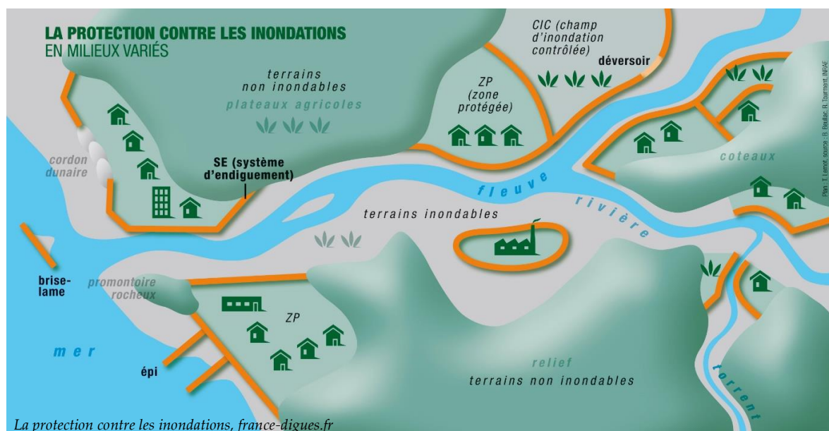
La protection contre les inondations, france-digues.fr

Les cours d'eau « masses d'eau » du bassin de la Save ont tous des merlons longitudinaux sur leurs berges. Certains cours d'eau sont fortement endigués, d'autres le sont beaucoup moins, notamment en têtes de bassin. Ces ouvrages hydrauliques ne seront pas classés en tant que système d'endiguement par le SYGESAVE. Leur neutralisation devra être étudiée, comme défini à l'Article L562-8-1 du Code de l'Environnement.